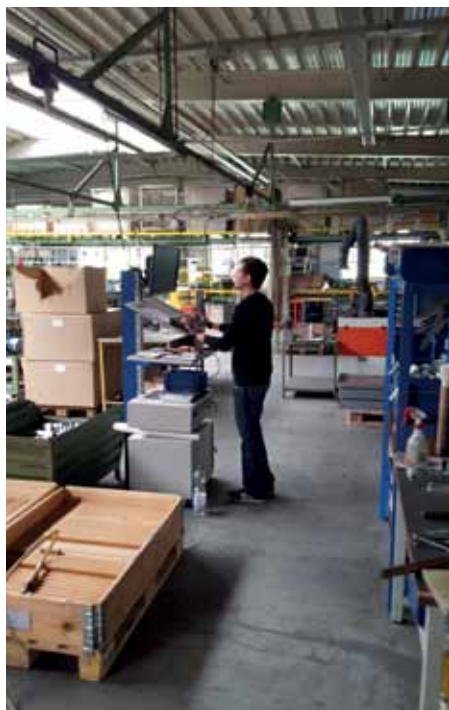
Mit der Digitalisierung der Logistik geht eine Umstellung von lange gewohnten Arbeitsroutinen einher.

Er braucht an dieser Stelle nicht mehr einzugreifen – eine effektive Entlastung der Meisterebene also.“